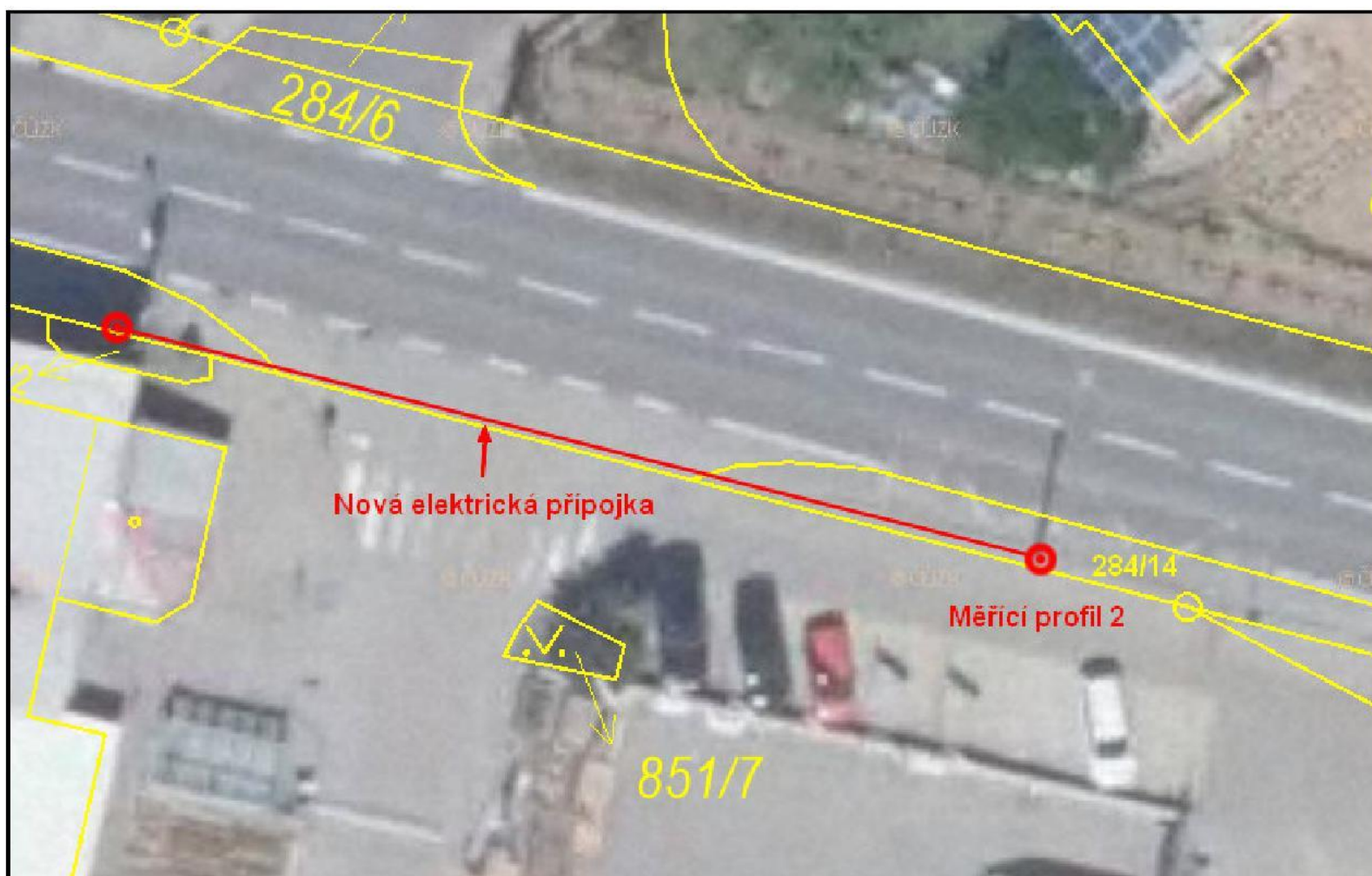
Schématické zakreslení VDZ: